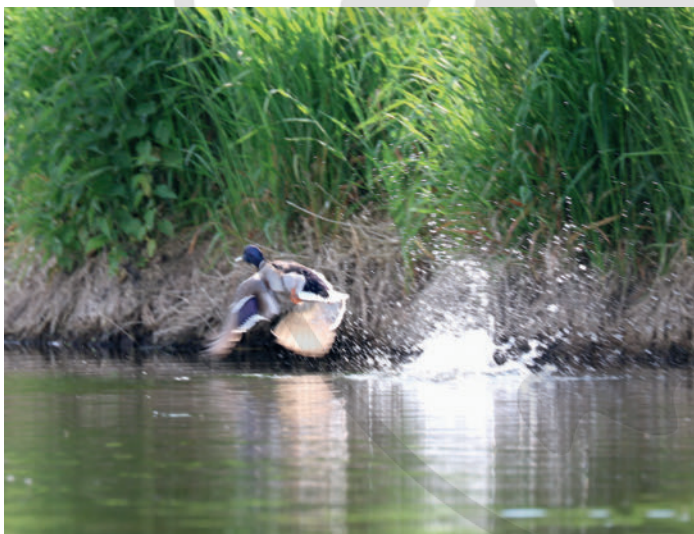
► Abb. 1 Staunen wir noch über uns vermeintlich bekannte Phänomene und fragen uns, wie es eigentlich sein kann, dass so etwas passiert? Wieso fliegt die Ente und kann aus dem Wasser starten? Oder wie können Kinder geboren werden? Wissen wir das wirklich?

In den Anfängen der Osteopathie in Deutschland gab es am Übergang von den 1980er- in die 1990er-Jahre eine Atmosphäre der Begeisterung für die Osteopathie, die mit reichlich Humor gespickt war. Wir brannten regelrecht und überschlugen uns im Interesse für diese besondere Methode, was das Lernen befeuerte und eigene Kreativität anregte. Es gab noch keine deutschsprachige Literatur – nur mündliche „Überlieferungen“ und wilde Sammlungen von Fotokopien. Der Anteil der praktischen Arbeit war sicher auch unstrukturierter und weniger differenziert als heute. Alles in allem gab es in den Schulen noch kein echtes didaktisches Konzept, sondern ein reichlich verworrenes Durcheinander. Auf den Postgraduate-Fortbildungen trafen sich viele interessante Persönlichkeiten, Originale, die keinen trockenen Stoff, sondern lebendige Osteopathie lehren oder lernen wollten. Abends feierten, musizierten und tanzten wir gemeinsam.